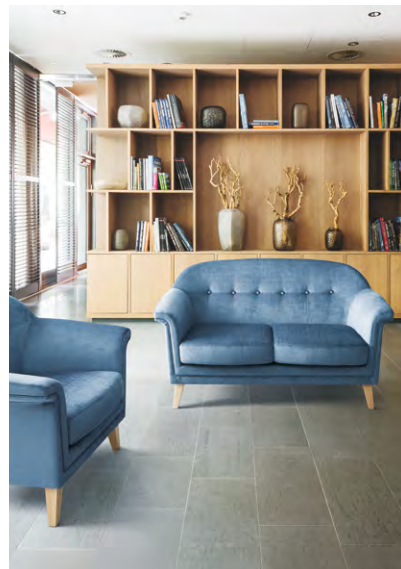
スージー >> P.269 / スピリットAC

ファブリック詳細 | スピリットAC >> P.474 ノルディウォームIIAC >> P.474