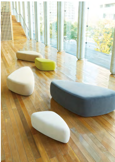
ロト >> P.334 / ノルディウォームIIAC