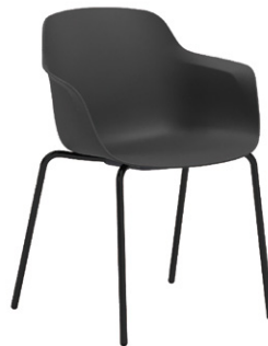
カーボンブラック