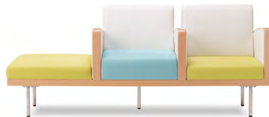
張地 背・肘 マニエラ L-8246 座(左右) マニエラ L-8261 座(中央) マニエラ L-8272(全てBランク)