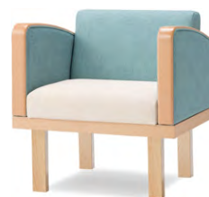
張地 背・肘 マニエラ L-8272 座 マニエラ L-8246(共にBランク)