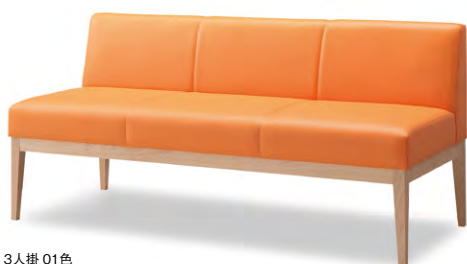
3人掛 01色 張地 アイコン ICO-24 (Aランク)