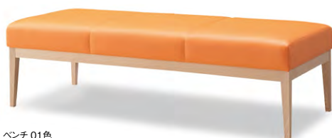
ベンチ 01色 張地 アイコン ICO-24 (Aランク)