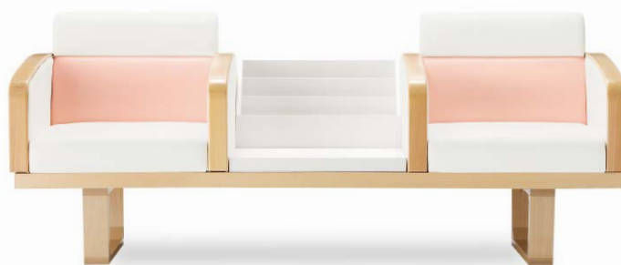
張地 背・肘・座 アイコン ICO-1(Aランク) 背下 アイコン ICO-23(Aランク) (P.312 CASE7 木製脚 Bタイプ)

お腹が大きい妊婦さんの身体に配慮し、お腹への負担を和らげ、腰をしっかり安定させます。体が沈み込みすぎないので立ち上がりもラクラクです。